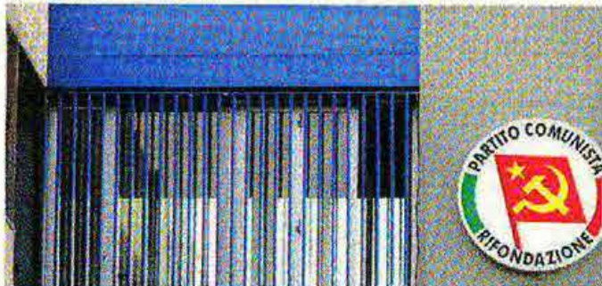
La sede di Rifondazione Comunista in via Gandhi

E' con questo spirito che una sede di partito è stata trasformata in bar - dormitorio per offrire un posto caldo e ac-