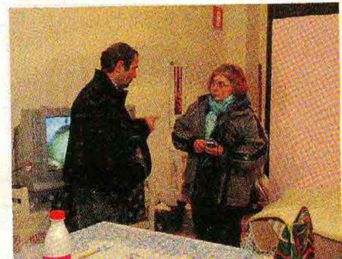
Grazie all'opera degli Adoratori sono aumentati gli alloggi per i clochard

L'ASSISTENZA AI CLOCHARD Impegnati nella preghiera quotidiana nella cappella del Santa Maria, gli Adoratori sono attivi anche nel sostegno ai senzatetto